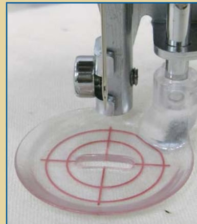
Klarsichtfuß Für unebene Oberflächen und Quilten in gleichmäßigen Abständen