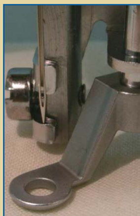
Geschlossener Fuß Für generelle Nutzung Speziell für Spitzen und Durchbruchstoffe