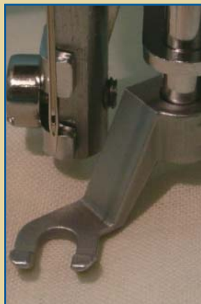
Offener Fuß Für generelle Nutzung Bessere Aufsicht auf den Nähbereich