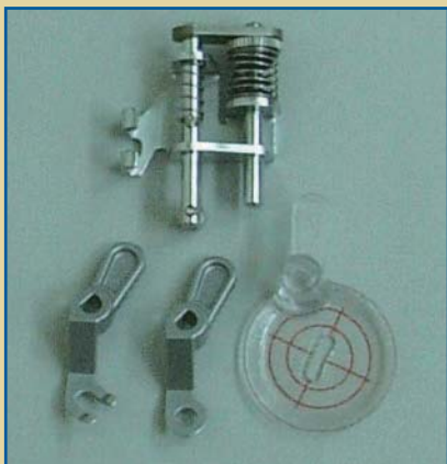
Set passend zu Hochschaffmaschinen und Memory Craft Näh-Stickmaschinen Teilenummer 202001003 (Blisterverpackung)