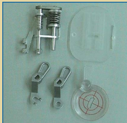
Set passend zu Tiefschaffmaschinen mit Horizontalgreifer Teilenummer 202002004 (Blisterverpackung) Hinweise: Tiefschaffset enthält Transporteurabdeckung