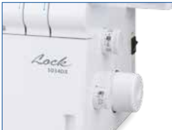
Einfache Stichweiten und -längen Regulierung über Drehrad